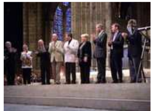
Remise des récompenses