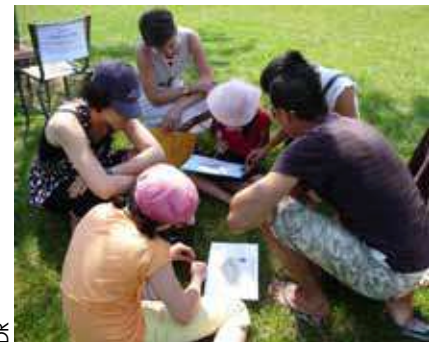
⌘ CATÉCHÈSE FAMILIALE