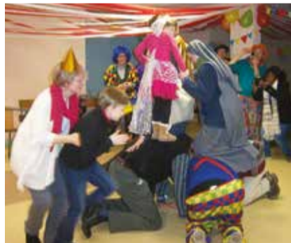
Premier de l'an fêté avec les enfants

Levées très tôt le matin pour une heure d'oraison silencieuse auprès du Saint Sacrement, leurs journées sont ponctuées par les offices, le chapelet et la messe, jusqu'à l'adoration silencieuse du soir. Désormais, quelques personnes se joignent régulièrement à ces temps de prière en confiant