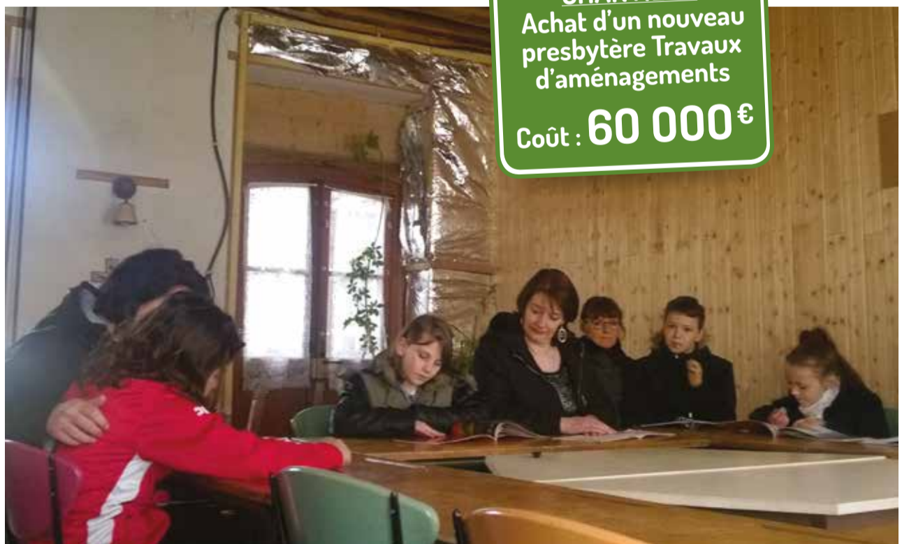
Les familles fidèles au catéchisme