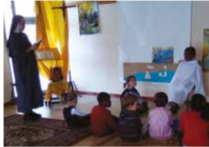
Apostolat auprès des enfants

Les coups de sonnette ponctuent aussi la journée ! Les allées et venues vont bon train au Prieuré mère Teresa, parfois juste pour un bonjour, des petits voisins qui voudraient jouer avec les « bonnes sœurs », raconter un malheur, partager une joie ou gentiment déposer quelque chose, la nourriture dont les sœurs ont besoin pour vivre, les vêtements en trop qu'elles redonnent à ceux qui en manquent... Tant de choses