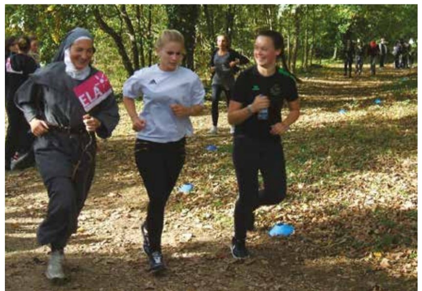
Les sœurs dans la course !

Thibault de Boisfossé, économiste diocésain