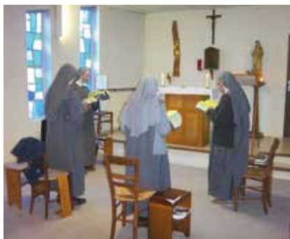
Prière de l'office ouverte à ceux qui le souhaitent

Depuis le 1 er septembre 2016 quelques sœurs Apostoliques de Saint-Jean ont la joie de vivre dans le diocèse de Chartres. Leur maison, ancien Couvent des sœurs de Picpus, maintenant appelé « Prieuré mère Teresa », se situe dans un quartier populaire de la ville de Dreux où elles côtoient des personnes d'origines très diverses principalement de religion musulmane. Sans avoir de mission officiellement tournée vers le dialogue interreligieux, elles ont à cœur de tisser des liens amicaux avec leurs voisins et cela commence à porter ses fruits. Jugez-en par vous-même : « Jésus Fils de Dieu, je ne peux pas. Jésus Crucifié, je ne peux pas. Mais vous, je vous aime ! » confie une personne musulmane devenue proche des sœurs.