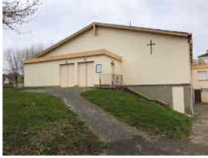
Extérieurs et intérieur de l'église. Chaudière à remplacer