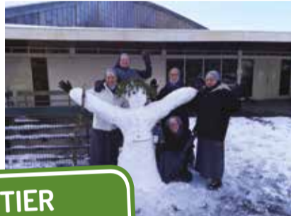
Répandre la joie !

CHANTIER Réfection de la toiture plate Coût : 30.000 € Réalisation : printemps 2018