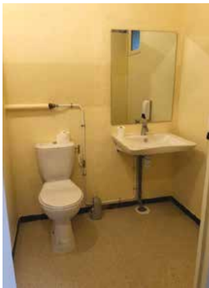
Chemin d'accès à reprendre et sanitaires à rénover