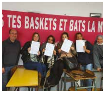
Apostolat auprès des jeunes

Cependant, d'autres événements ont occupé les sœurs ces derniers temps : la neige