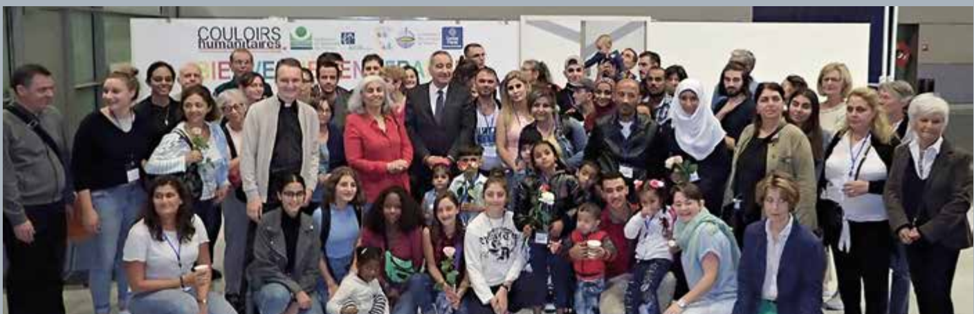
Accueil de familles syriennes venant du Liban via les couloirs humanitaires le 6 octobre 2018.

Pour plus de renseignements : 01 42 03 11 41 - contact@santegidio.fr - www.santegidio.org