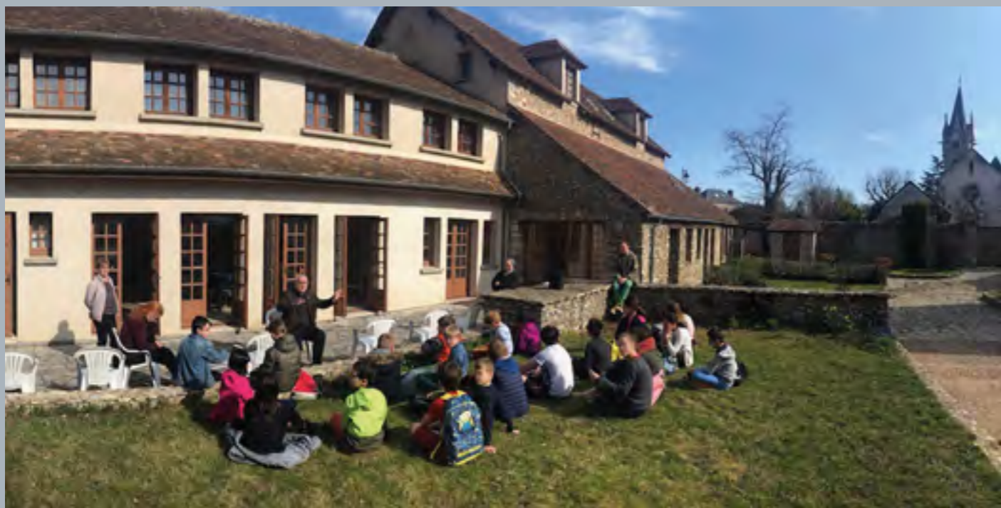
La Maison est au service de tous les groupes pour une journée de retraite.